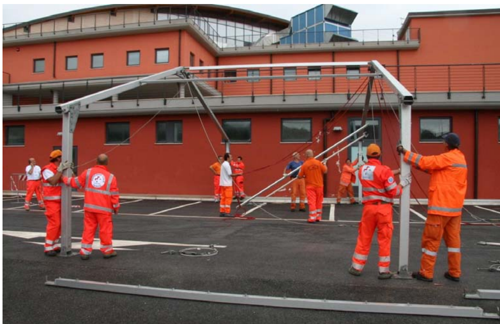
2007 Ancona: Meeting Nazionale Anpas - Esercitazione di Protezione Civile "La costruzione del campo base"

Il dato in netta controtendenza non è solo la distribuzione territoriale, ma soprattutto la percentuale di copertura posti (85%) che è assolutamente sopra la media nazionale considerando la concentrazione di posti al centro-nord e, dato da non sottovalutare, considerando il settore di attività della maggior parte dei progetti Anpas che sono incentrati sull'assistenza. Altra caratteristica importante è il numero di posti per sede che ha una media di 4,3 unità per associazione.