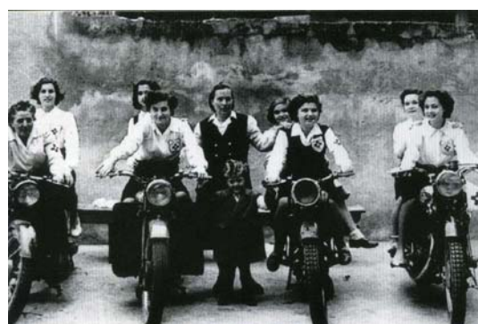
Anni'50, Pubblica Assistenza – Piombino gruppo di volontarie con le moto dell'associazione