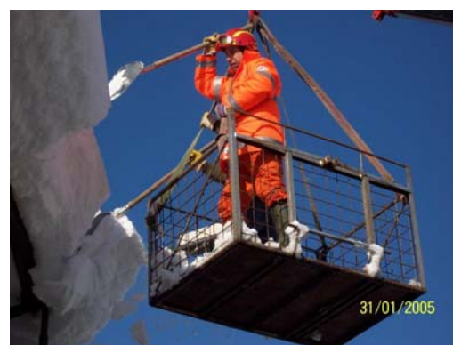
2005 Basilicata: Intervento Volontari Anpas per emergenza neve