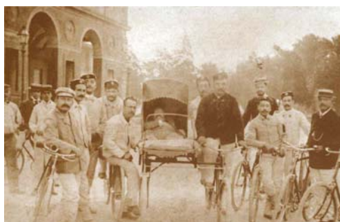
1900, P.A. Fratellanza Militare - Firenze: presentazione della lettiga tandem