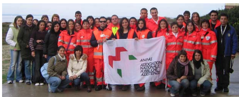
2006 Orgosolo: Corso di formazione Anpas volontari in Servizio Civile Nazionale